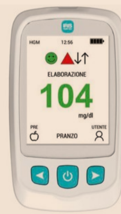
Iris Hybrid L'innovazione nella Gestione del Diabete