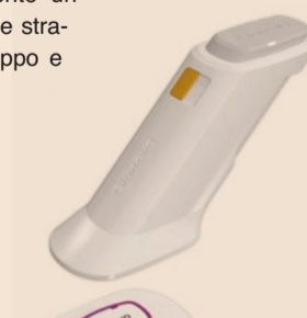
Glunovo Holter: L'innovazione nel Monitoraggio del Glucosio