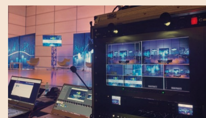
Un evento 24 ORE Eventi

Il comparto eventi è uno dei settori più colpiti dagli effetti della pandemia che ha segnato dolorosamente il 2020. Si parla, secondo ricerche indipendenti e fonti autorevoli, di una perdita di fatturato tra il 35 e l'85 per cento e un settore che nei prossimi anni vedrà assottigliarsi le file degli addetti ai lavori probabilmente tra il 30 e il 40 per cento. In più, si parla di escludere gli eventi in presenza, oltre che per tutto l'anno passato anche per buona parte del prossimo venturo: siano essi fiere, congressi, meeting ma anche eventi "consumer" come spettacoli, matrimoni, e manifestazioni locali.